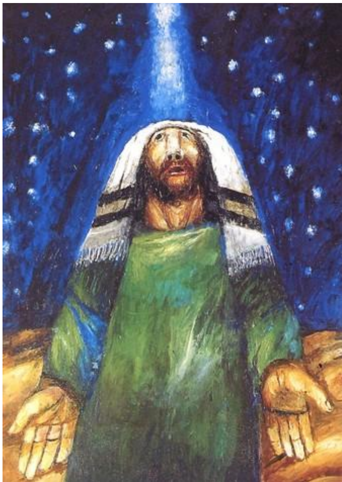
Sieger Köder, Abramo

Guardiamo il cielo. Contemplando dopo millenni lo stesso cielo, appaiono le medesime stelle. Esse illuminano le notti più scure perché brillano insieme. Il cielo ci dona così un messaggio di unità: l'Altissimo sopra di noi ci invita a non separarci mai dal fratello che sta accanto a noi. (papa Francesco)