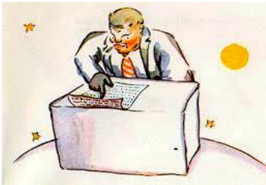
(Immagine tratta da Il Piccolo Principe , Antoine De Saint-Exupéry)