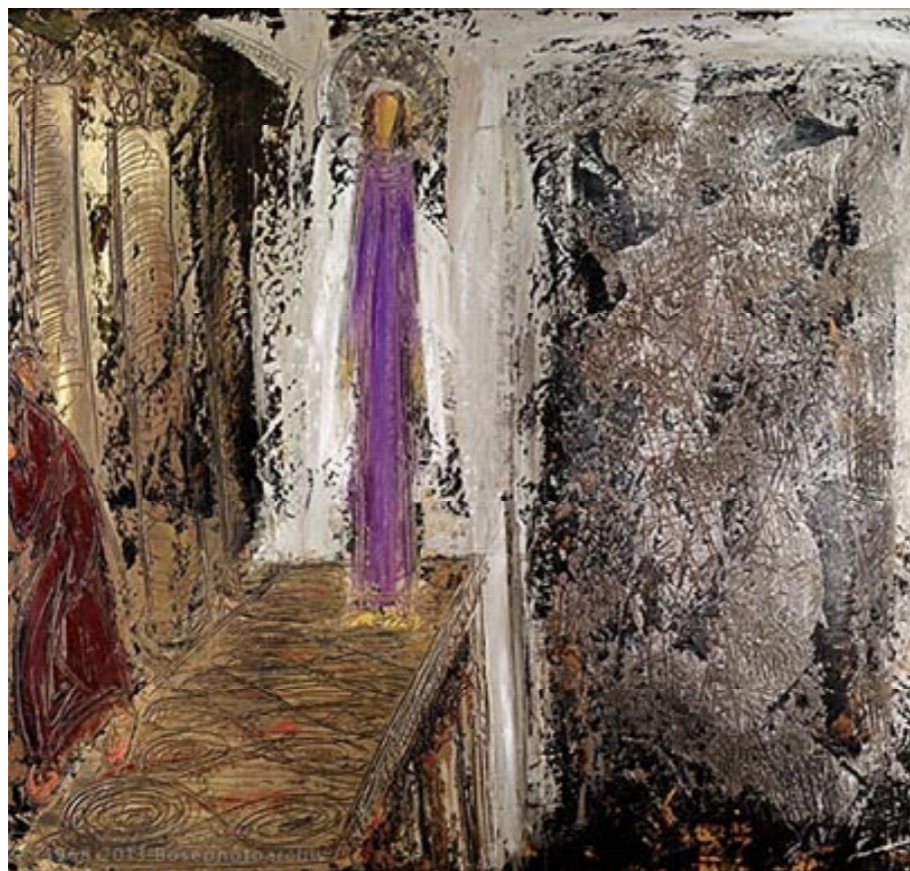
William Congdon, Ecce homo

La risurrezione di Lazzaro profetizza la risurrezione di Cristo. Gesù appare vestito di viola, tinta ottenuta dal blu e dal rosso, i colori associati alla sua umanità e divinità. Da uno sfondo buio e da un intreccio di materiali scuri spicca la figura salvifica del Cristo, la luce che vince sulle tenebre.