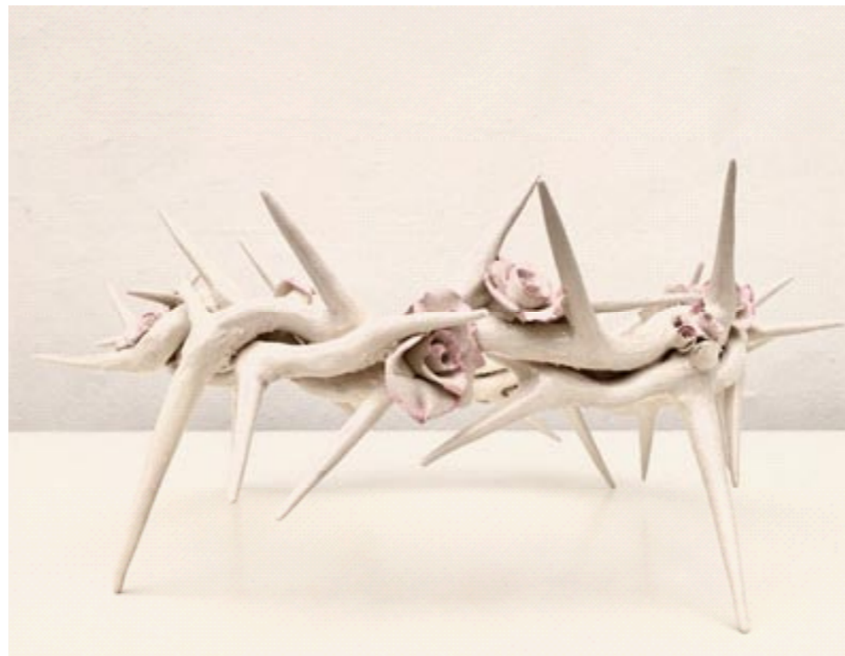
Fabio Ricciardiello, Corona fiorita , 2019 Museo Diocesano di Faenza

Una corona in ceramica, rami intrecciati con spine lunghe da cui fioriscono piccole rose. Lo strumento della Passione di Cristo non trasmette più dolore e umiliazione, quei minuscoli fiori esprimono la vittoria della vita sulla morte e l'amore illimitato di Dio.