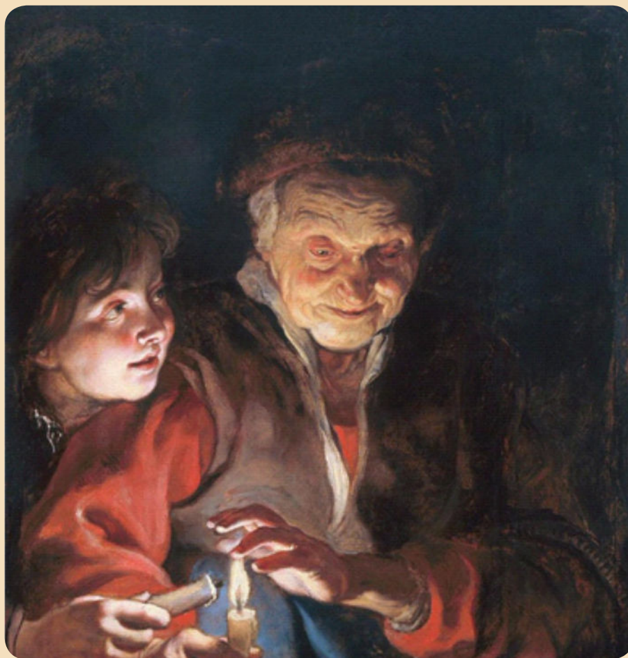
Scena notturna, Peter Paul Rubens

Vegliate dunque, perché non sapete in quale giorno il Signore vostro verrà.