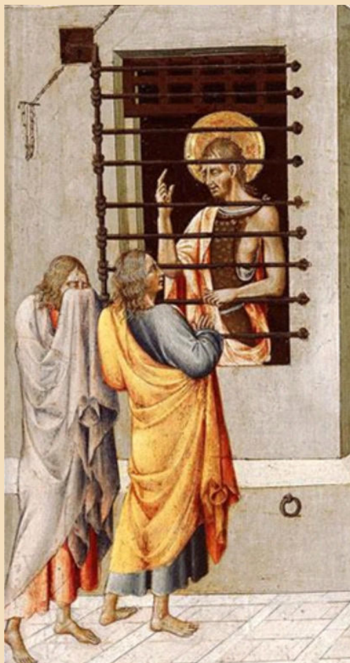
San Giovanni Battista in prigione, visitato da due discepoli, Giovanni di Paolo

I l Battista si trova in carcere nella fortezza di Erode, solo e lontano dalla folla. C'è un interrogativo che abita i suoi pensieri.